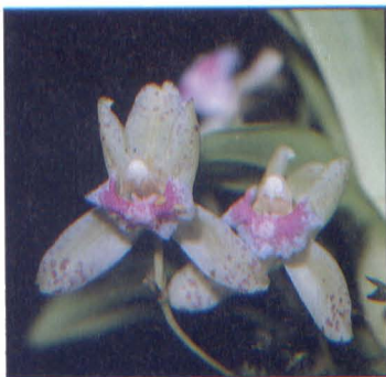
Kefersteinia oscarii Ortiz Cultivo: Martha Posada de Robledo Fotografía: Pedro Ortiz V.